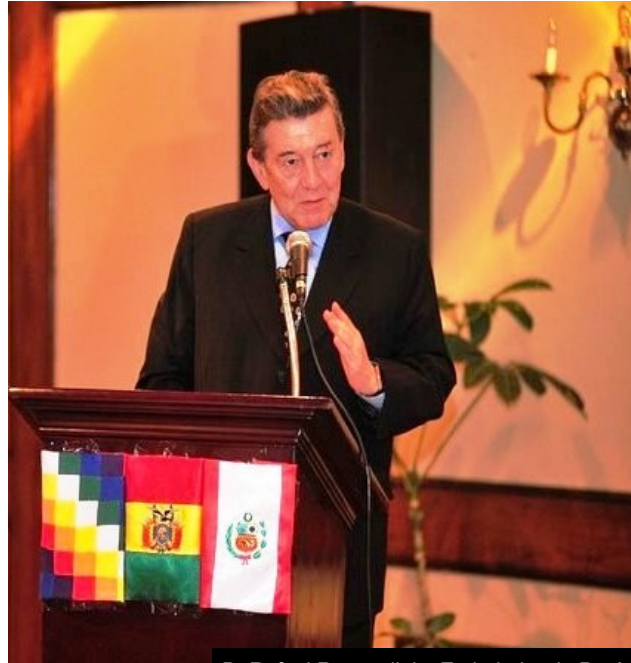
D. Rafael Roncagliolo, Embajador de Perú en España,

El flamante Embajador, presentó copia de sus cartas credenciales al señor Introdutor de Embajadores del Ministerio de Asuntos Exteriores y de Cooperación de España el pasado 28 de abril de 2015.