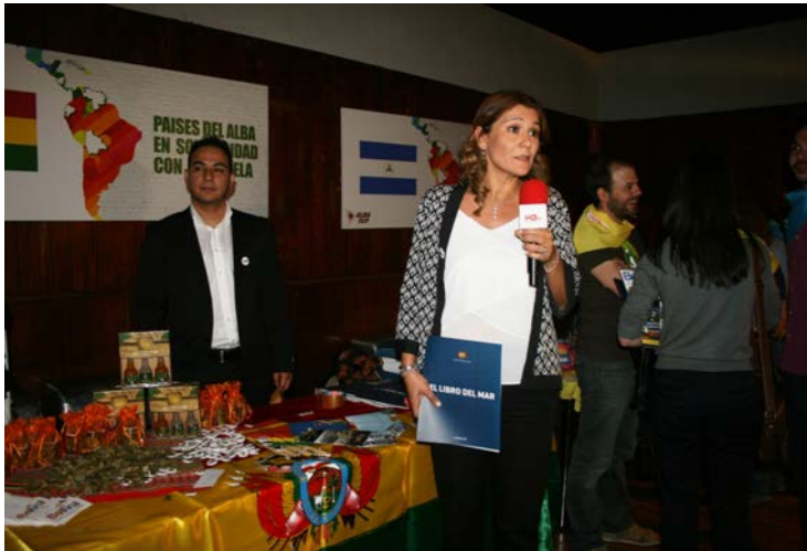
Encargada de Negocios de la Embajada de Bolivia, respondiendo a entrevistas de los medios de comunicación.