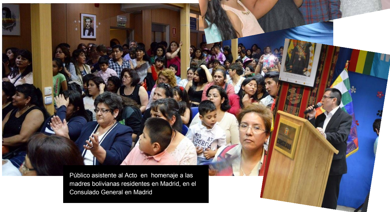
Público asistente al Acto en homenaje a las madres bolivianas residentes en Madrid, en el Consulado General en Madrid