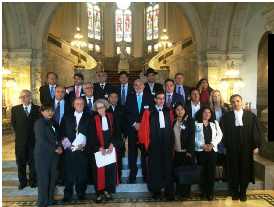
Equipo jurídico y Delegación boliviana, en la histórica presentación de alegatos de Bolivia y Chile en la Corte Internacional de La Haya.

B olivia y Chile acudieron ante la Corte Internacional de Justicia de La Haya. Entre el 4 y 8 de mayo, ambos países presentaron sus alegatos para que el tribunal defina si es competente o no para tratar el litigio internacional sobre el diferendo marítimo.