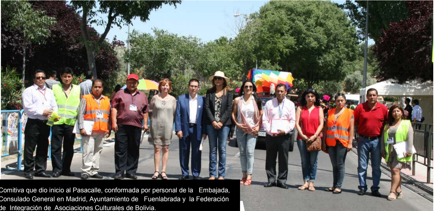
Comitiva que dio inicio al Pasacalle, conformada por personal de la Embajada, Consulado General en Madrid, Ayuntamiento de Fuenlabrada y la Federación de Integración de Asociaciones Culturales de Bolivia.