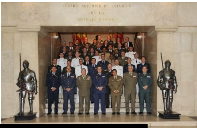
Oficiales superiores graduados del decimotercer Curso de Altos Estudios Estratégicos.