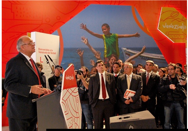
Embajador de Venezuela en España, dirigiéndose al público asistente