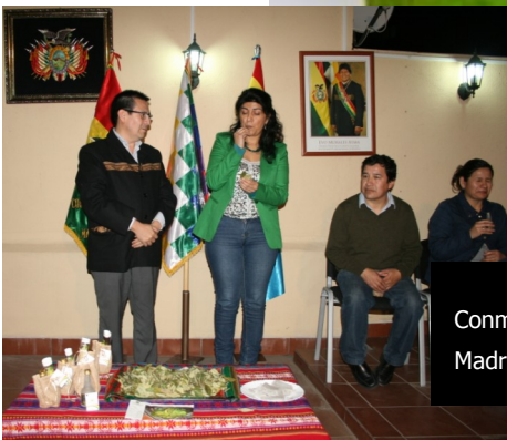
Commemoración del Día Nacional del Akhullico en Madrid

La Embajada de Bolivia en España, el Consulado General en Madrid y la comunidad boliviana, reunidos alrededor de la hoja de coca, para celebrar el 12 de marzo Día Nacional del Akhullico, en un encuentro entre hermanos que están lejos de su tierra, pero cerca de sus costumbres y tradiciones ancestrales.