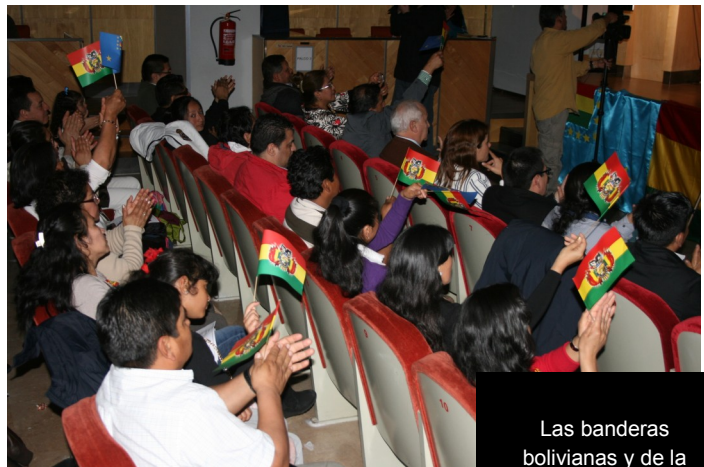
Las banderas bolivianas y de la reivindicación marítima en alto expresando el compromiso con la causa boliviana.

El evento contó con la presencia del Director de Relaciones Institucionales del grupo Globalia de Air Europa, quien junto a la Encargada de Negocios de la Embajada entregó los dos pasajes ida y vuelta a Bolivia, que fueron sorteados gracias al patrocinio de esta empresa.