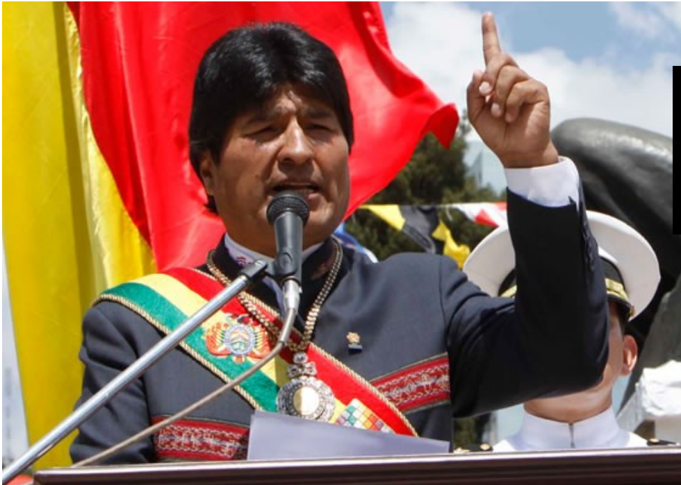
Presidente Evo Morales en ocasión de pronunciar su discurso por el 23 de marzo.

"E l Presidente del Estado Plurinacional de Bolivia, en ocasión de conmemorar los 136 años de la pérdida del Litoral boliviano pronunció un sentido discurso en el que saludó la determinación y la lucha del pueblo boliviano que durante más de un siglo no ha renunciado ni claudicado en su lucha por volver con soberanía a las costas del océano Pacífico.