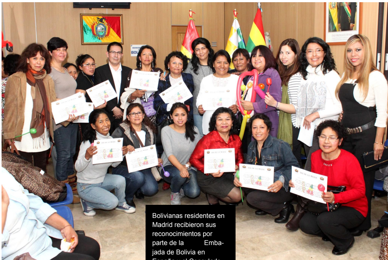
Bolivianas residentes en Madrid recibieron sus reconocimientos por parte de la Embajada de Bolivia en España y el Consulado General en Madrid